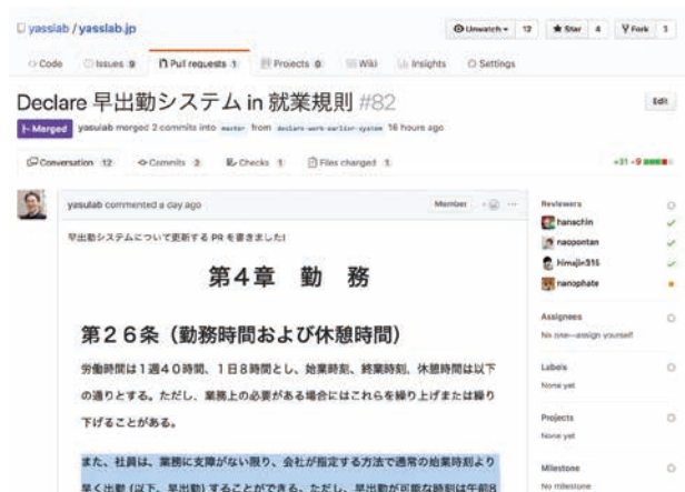
■ 図-2 就業規則を GitHub で管理する