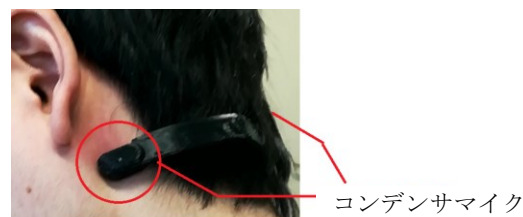
図2: 2chマイクの装着例

20代の男女18名から、チューインガム、クラッカー(リッツ)、キャベツ(千切り)の食事音を、耳下2chコンデンサマイクにより収録(サンプリング周波数22KHz、量子化16bit)した。2chマイクの装着例を図2に示す。2chマイクは3Dプリンタを用いて独自で制作したものである。